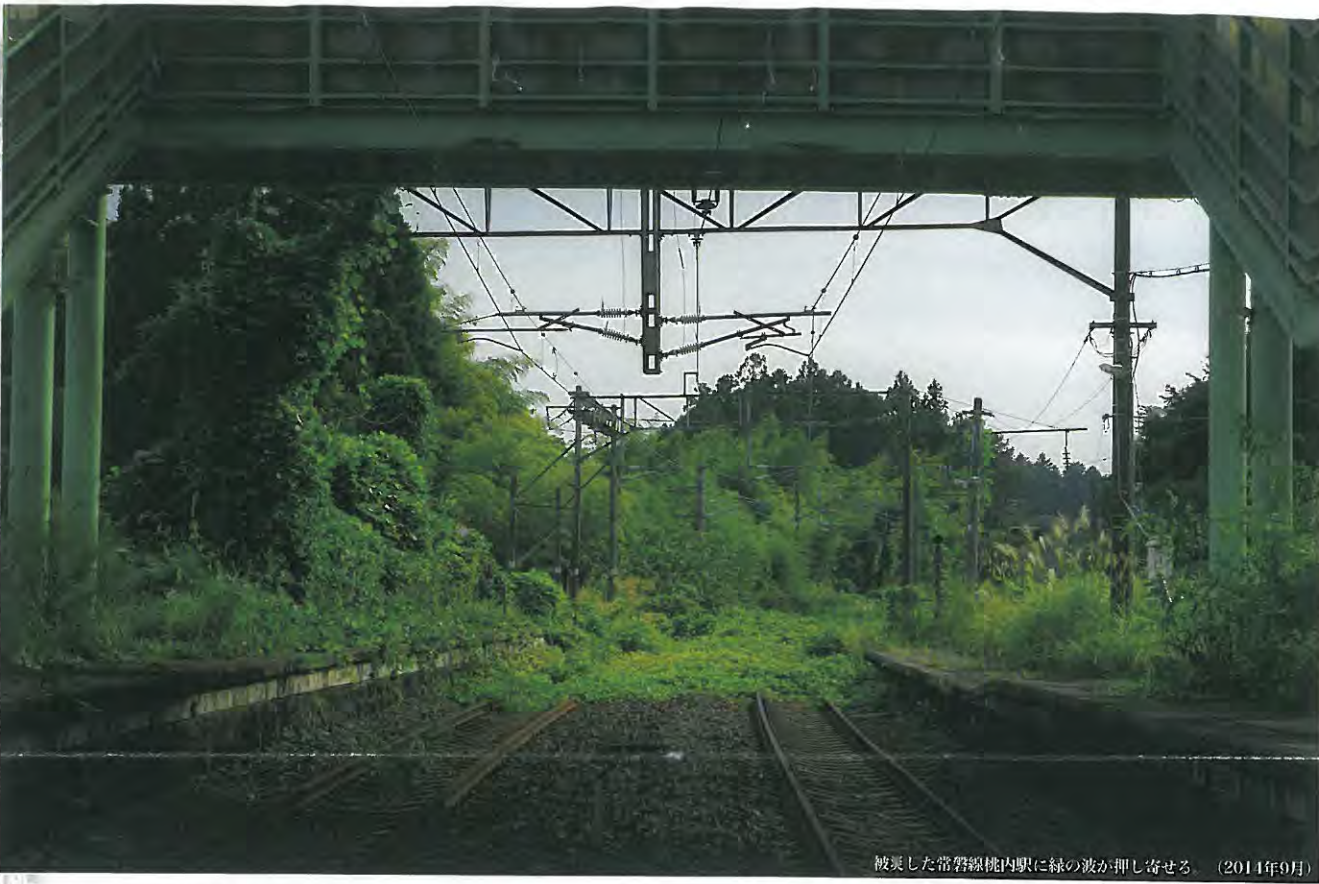
被災した常磐線管内に緑の波が押し寄せる。(2014年9月)

この五年、見て見ぬふりをしてきた。写真を見てこれは 私の問題 なのだ。初めて気がついた。(神奈川 主婦 32才) 日常のあたりまえ、そのありがたさを知らなかった。(札幌 21歳 大学生) これからは生きる子供に残せる一番大切なものが見えてきたような気がする。(函館 会社員 49才) 核と人類は共存できない。それは七十一年前の私の 古傷 も語っている。(広島 語り部 81才) 行ったことのない浪江の街がぼうつと立ち上がった。思わず 故郷を思い出した 。(多摩 会社員 28才) チェルノブイリをはじめてみました。(札幌 小学生 10才)